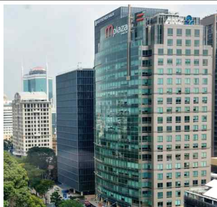
Mplaza 빌딩 외관