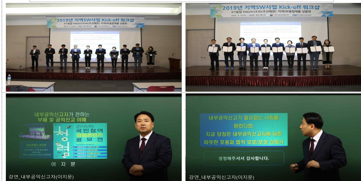
【 지역SW사업 Kick-off 워크샵 청렴활동 사진 】