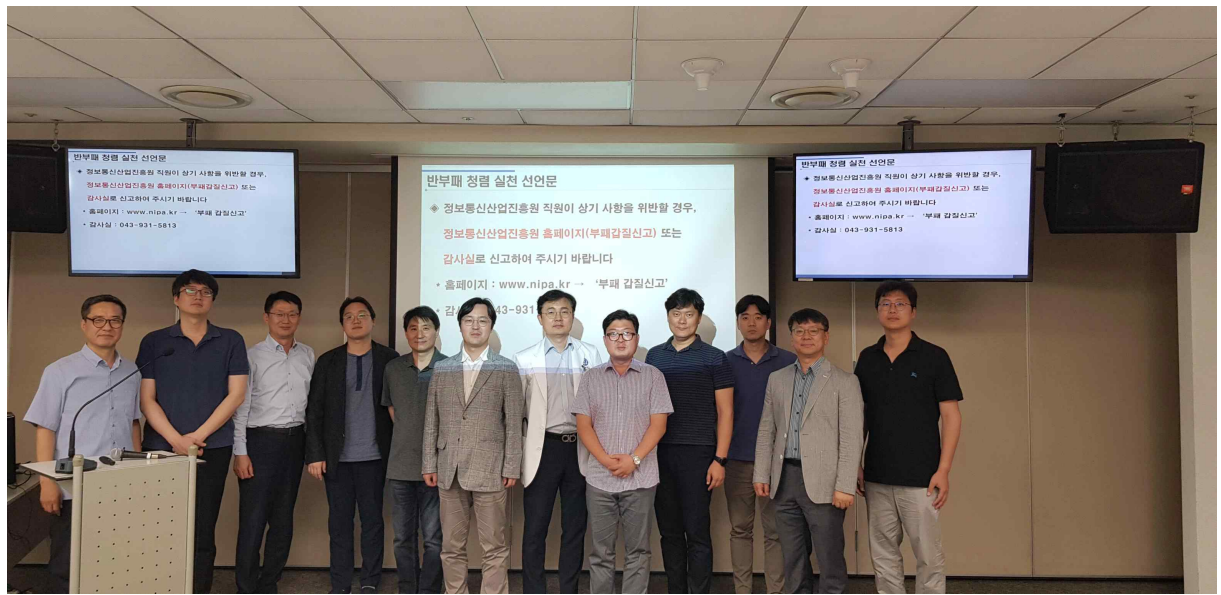
【 반부패 청렴 선언 사진 】