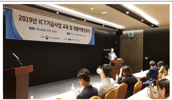
반부패·청렴 및 인권선언문 전파