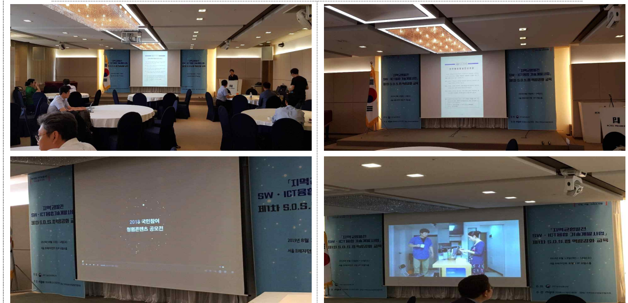
【 지역균형발전 1차 집체교육 청렴활동 사진 】