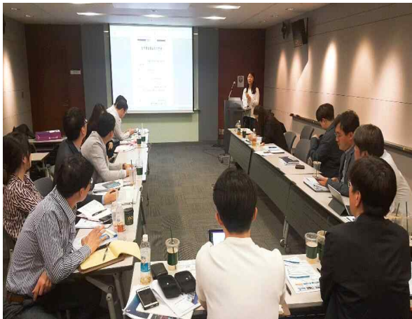
【 SW미래채움사업 Kick-off 청렴활동 사진 】