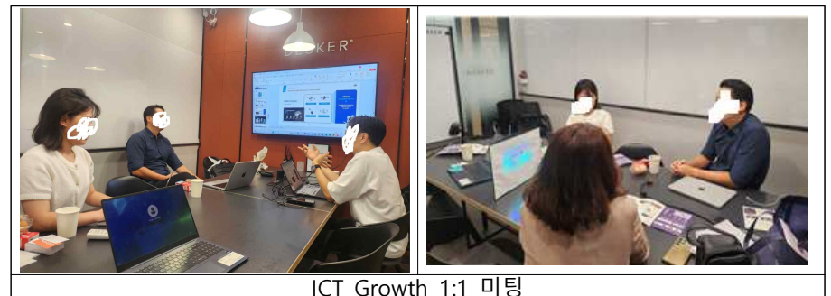
ICT Growth 1:1 미팅