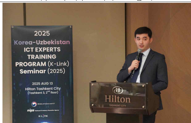
(우즈베크 이브로킴 이스로일로프 발표)