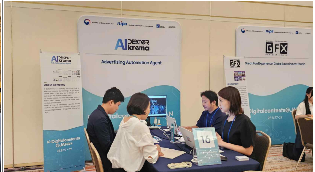
▲ 기업 1:1 비즈니스 밋업