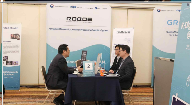
▲ 기업 1:1 비즈니스 미팅