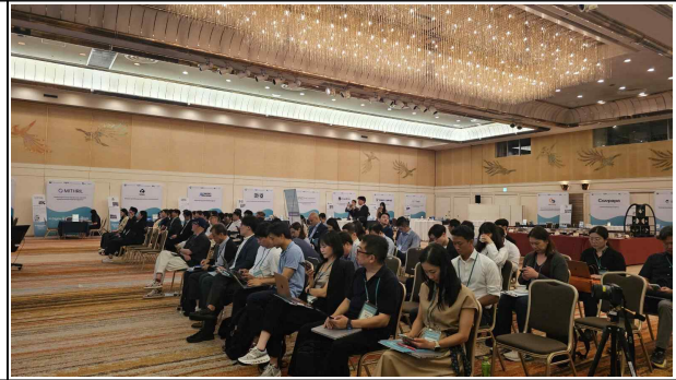
▲ 영문 IR 피칭