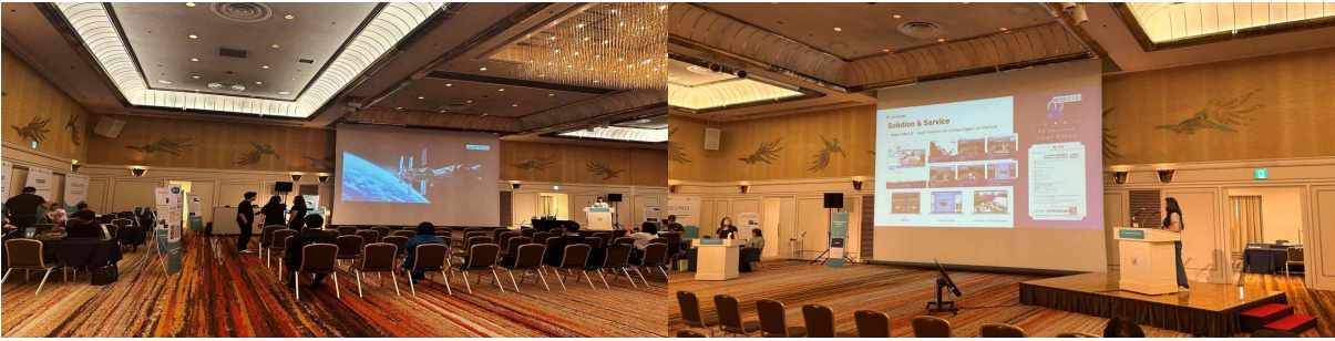
▲ 영문 IR 피칭 리허설