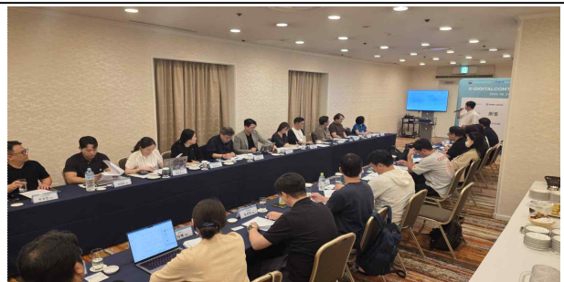
▲ 간담회 사진