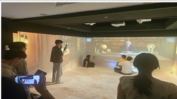
<인플루언서 활용 홍보영상 촬영①>