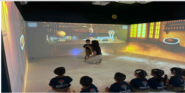
<유아 대상 플랫폼 실증①>