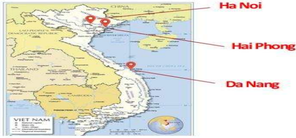
<베트남 영업대상 지역>