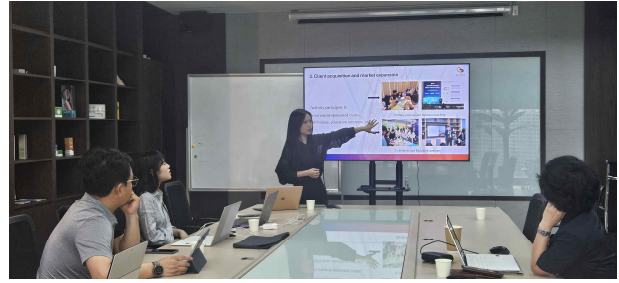
<현지 용역사 업무브리핑>