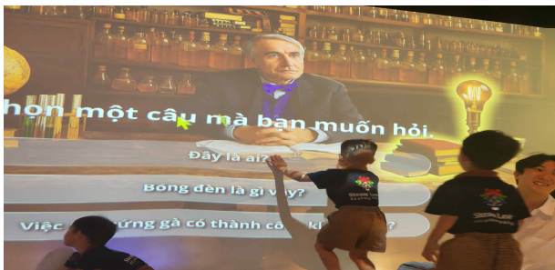
<유아 대상 플랫폼 실증③>