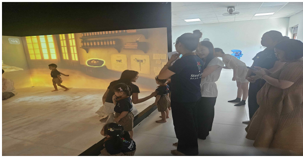
<교사 대상 활용 교육>