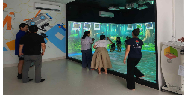
<현지 신문사 인터뷰 및 홍보사진 촬영>