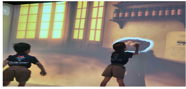
<유아 대상 플랫폼 실증④>