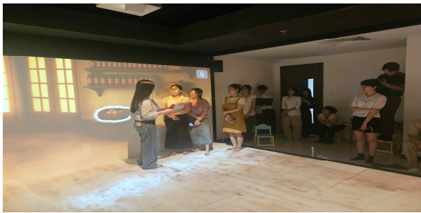
<하동유치원 교사대상 교육 및 실증①>