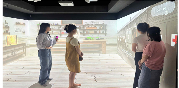
<하동유치원 교사대상 교육 및 실증②>