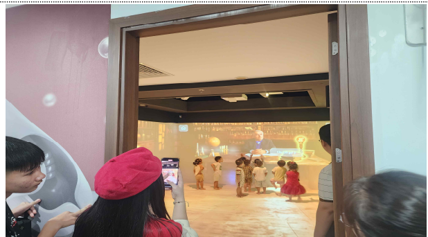
<인플루언서 활용 홍보영상 촬영②>